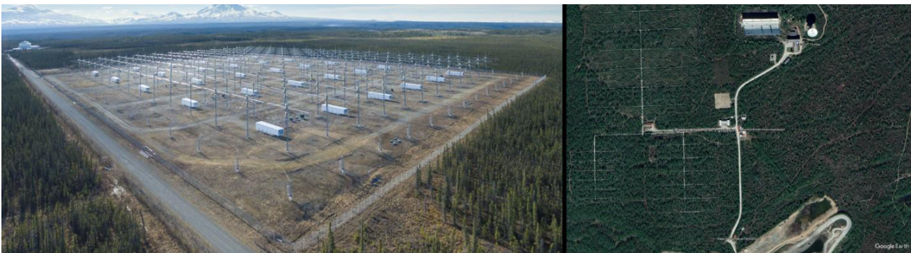
Figure 2. À gauche : Installation du High Frequency Active Auroral Research Program (HAARP) à Gakona, Alaska (États-Unis). À droite : Installation norvégienne de chauffage de l'ionosphère de Tromsø.

La figure 2 (à gauche) montre le réchauffeur ionosphérique HAARP à Gakona, en Alaska (États-Unis). Ses 180 unités sont capables de produire une puissance rayonnée totale de 3,6 MW avec une puissance rayonnée effective d'environ 575 MW [36, 41]. La figure 2 (à droite) montre l'un des autres réchauffeurs d'ionosphère, celui de Tromsø, en Norvège, dont la puissance rayonnée effective est de 300 MW [29, 31, 42] et qui, comme HAARP, est capable de déclencher des tremblements de terre [38-40].