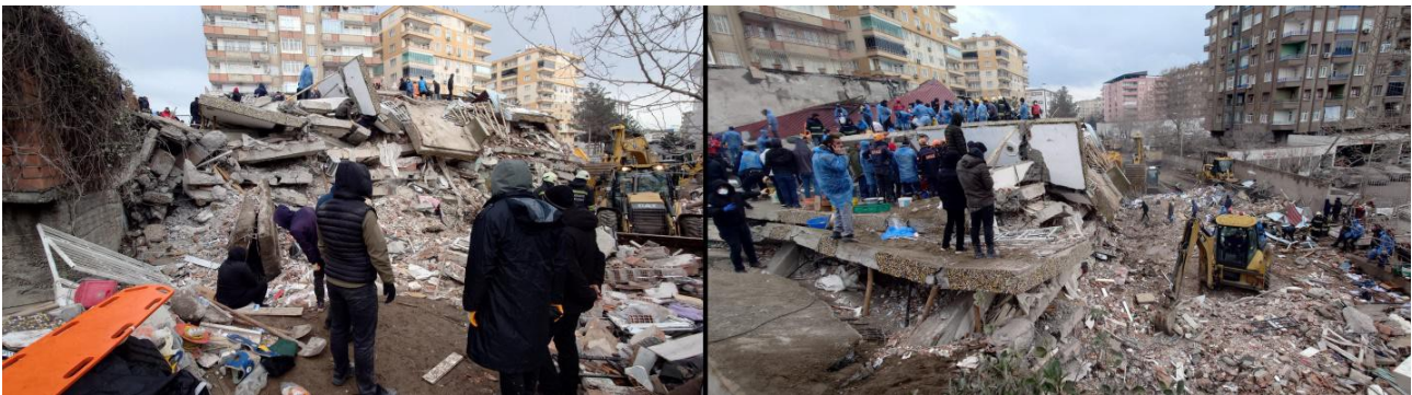
Figure 1 : Scènes de destruction du tremblement de terre du 6 février 2023 en Turquie

Le 6 février 2023, un puissant tremblement de terre de magnitude 7,8 s'est produit dans le sud de la Turquie, près de la frontière nord de la Syrie. Ce tremblement de terre a été suivi environ 9 heures plus tard par un tremblement de terre de magnitude 7,5 à environ 90 km au nord [8]. Ces tremblements de terre et leurs répliques ont dévasté certaines parties de la Turquie et de la Syrie, faisant plus de 55 100 victimes, la majorité étant des femmes et des enfants [9-11], et environ 1,5 million de personnes se sont retrouvées sans abri [12] (Figure 1). Les informations diffusées avant et immédiatement après l'événement, ainsi que les faits scientifiques et les circonstances présentés ci-dessous, justifient une enquête complète et approfondie de la Cour pénale internationale sur notre allégation selon laquelle le tremblement de terre du 6 février 2023 a été délibérément déclenché et constitue des crimes de guerre et des crimes contre l'humanité.